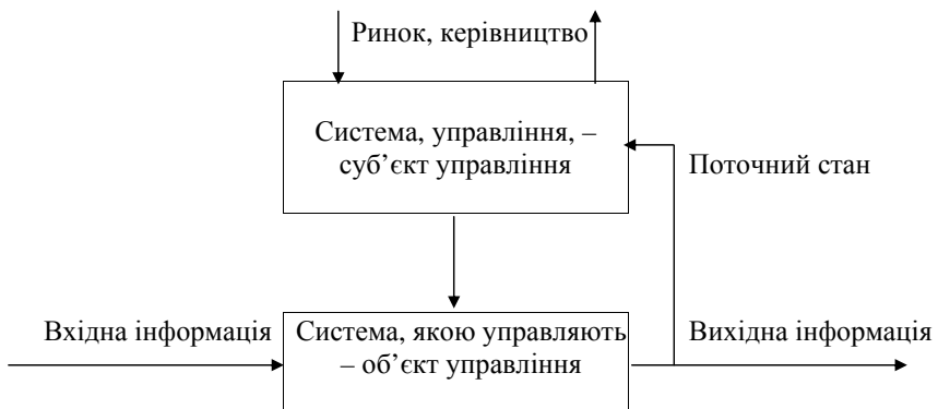
Рисунок 1.2 – Структура системи управління підприємством

Розглянемо поняття економічної інформації на прикладі системи управління підприємством (рис.1.2).